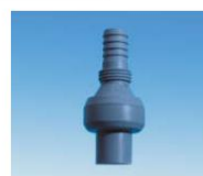
Zpětný ventil s odvzdušňováním / zpětný ventil s odvzdušňováním 3004,53,00