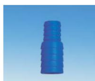
Přípojení ventilace / přípojení ventilace C1.0605.01